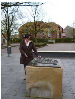
Gästeführerin mit taktilem Stadtmodell